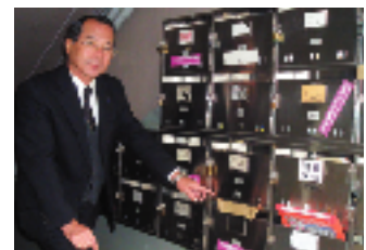
封印された空き室の郵便ポスト

「都営住宅に入りたい」と、応募者が急増しています。この声に応えて、私は、空き室調査をおこないました。区内都営住宅6,571戸にたいし255戸が空き室で、下馬都営団地は1,449戸にたいし49戸が空き室でした。空き室があっても入居の募集をしない都の姿勢は重大です。(東京全体では11,500戸が空き室)