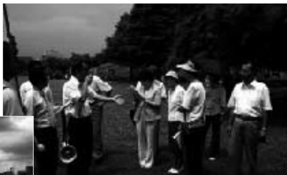
ビーチバレー予定地の潮風公園

高い評価を得るためのごまかしの申請は許されません。私は、7月18日、申請したファイルの競技施設予定地を確認するため現場を視察し、あらためて計画のずさんさを痛感しました。