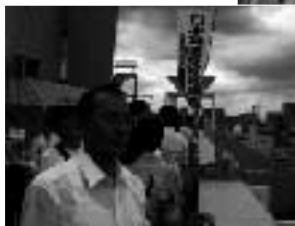
3メインスタジアム予定地をのぞむ晴海埠頭