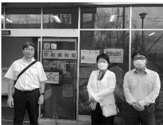
区議団で「災害と平和」展へ

9月1日から30日まで、世田谷公園内の区立平和資料館で、関東大震災100年から考える「災害と平和」展が実施されました。